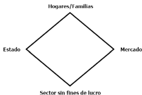
Figura 1: El diamante del cuidado

...y sus funciones varían con cada país y con el tiempo